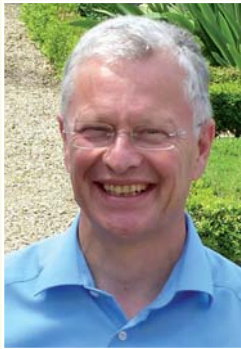
Grußwort des Landrates Frank Puchtler

Ich freue mich, dass im Sinne unseres neuen Rhein-Lahn-Kreis-Slogans „Wir bringen's. Zusammen.“ auf Initiative der Stadt und des Stadt- und Touristikmarketing Bad Ems e.V. auch in diesem Jahr wieder zahlreiche Firmen aus Bad Ems zusammengefunden haben, um das Forum der „Gesundheitstage Bad Ems“ zur Präsentation ihrer Leistungsfähigkeit zu nutzen und dem Gesundheitsstandort Bad Ems werbendes Gewicht zu verleihen.