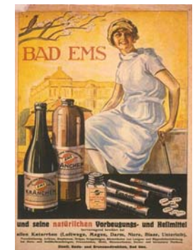
Emser Pastillen Bekanntes Produkt aus dem Quellsalz (Werbeplakat)