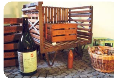
Emser Kränchen In Mineralwasserkrügen gelangte das Heilwasser in alle Welt

Balkleid und Küchenschürze – Leben im Kurort