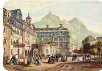
Kurpromenade um 1850 Lithografie von George Barnard