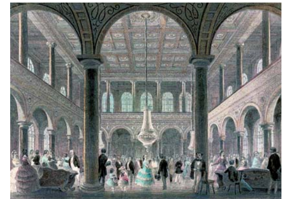
Theater, Ball und Tanz im Kursaal: Der prächtige Marmorsaal war Mittelpunkt des Kurlebens