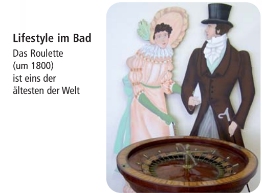
Lifestyle im Bad Das Roulette (um 1800) ist eins der ältesten der Welt

Balkleid und Küchenschürze – Leben im Kurort