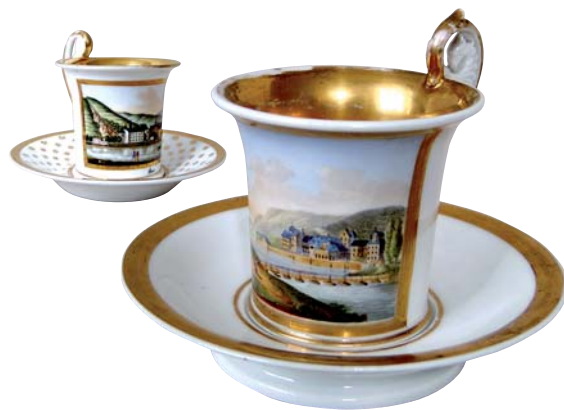
Bad Ems Schmucktassen mit Ansichten von Bad Ems

Im prachtvollen Kursaal begeisterten Jacques Offenbach, Clara Schumann und Franz Liszt das internationale Publikum.