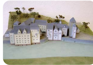
Das Emser Bad um 1600 Modell